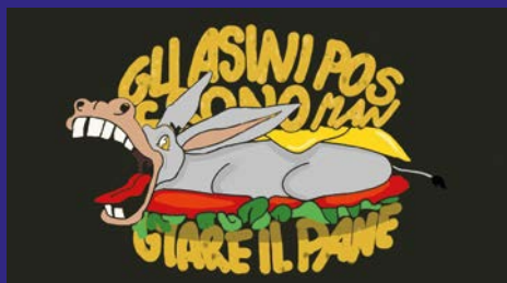
Gli asini possono mangiare il pane