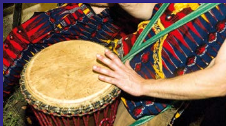
Aniké Percussioni tradizionali africane