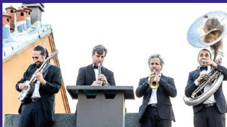
Hot Jazz Fm Parata e live concert