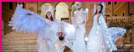
Circotà Parata sui trampoli