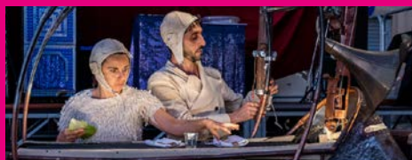
Teatro C'art in "Woow parade"